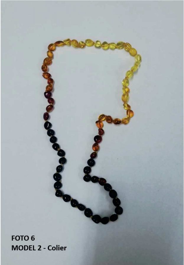
FOTO 6 MODEL 2 - Colier