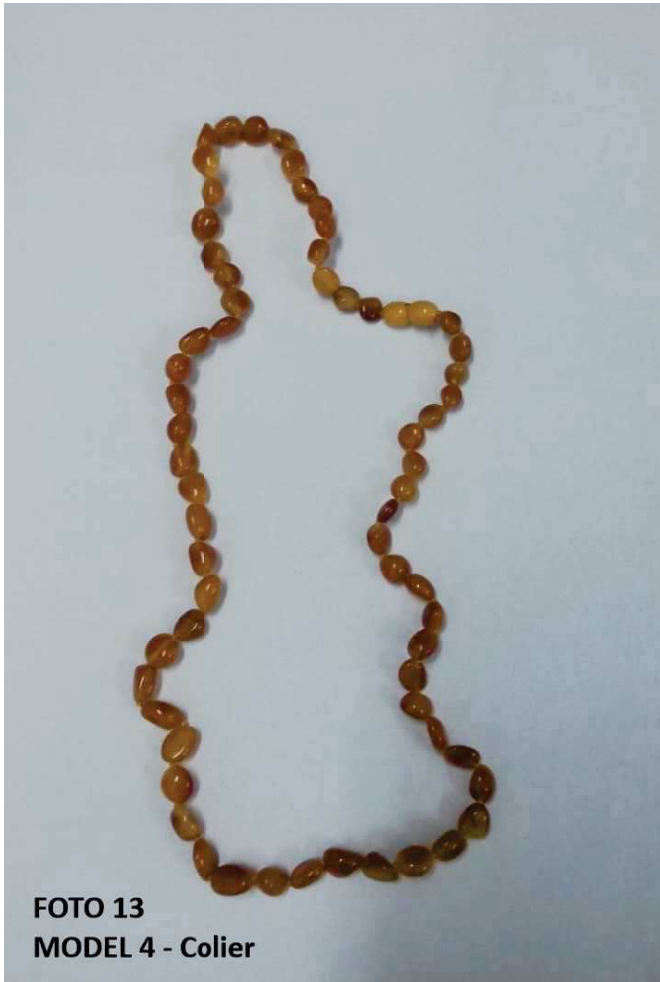
FOTO 13 MODEL 4 - Colier