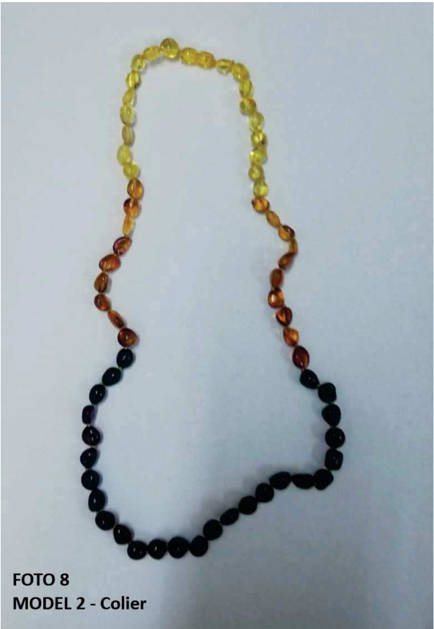
FOTO 8 MODEL 2 - Colier