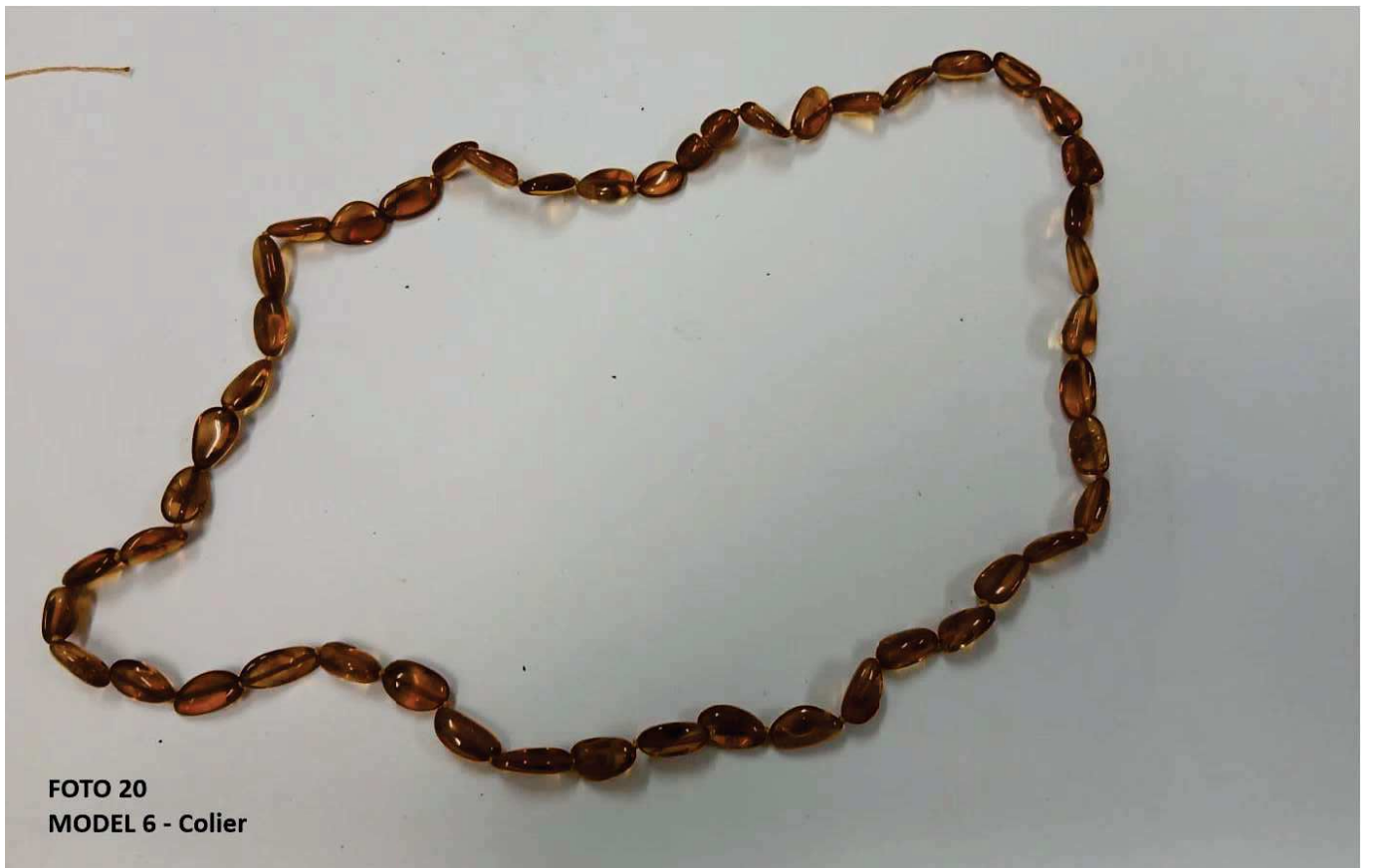
FOTO 20 MODEL 6 - Colier