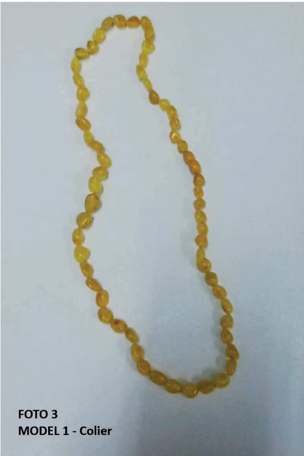
FOTO 3 MODEL 1 - Colier