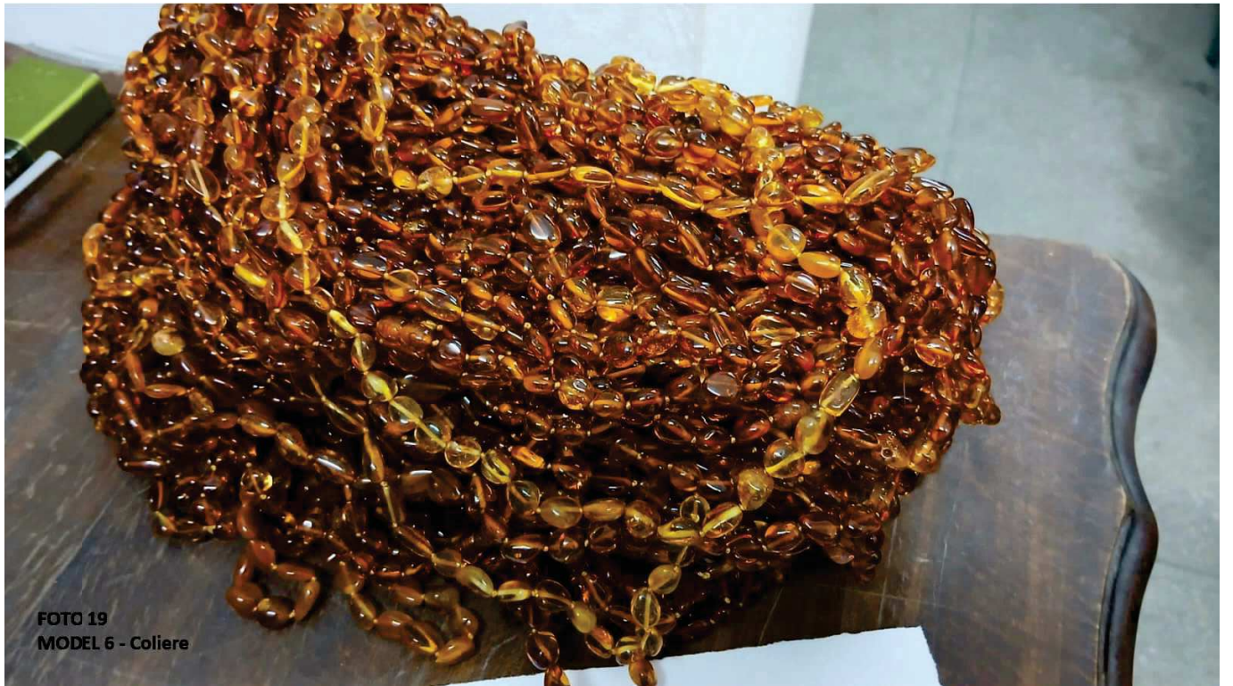
FOTO 19 MODEL 6 - Coliere