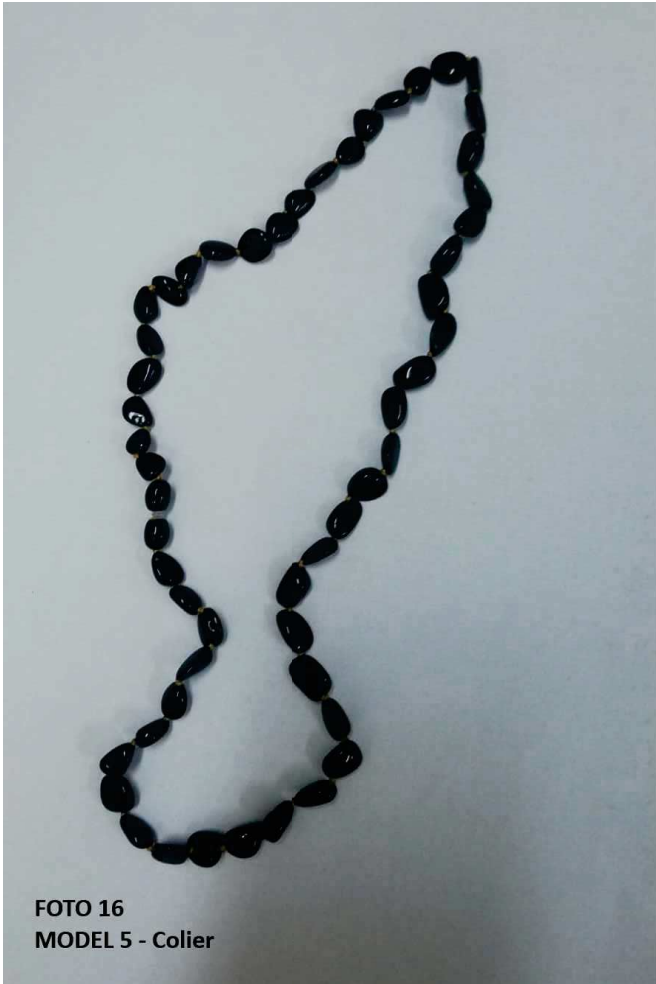
FOTO 16 MODEL 5 - Colier