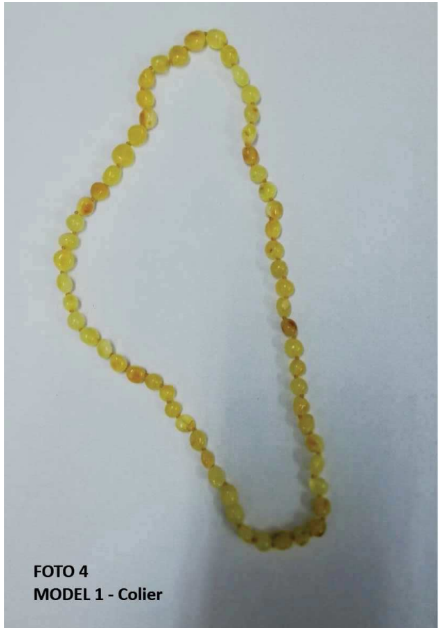
FOTO 4 MODEL 1 - Colier