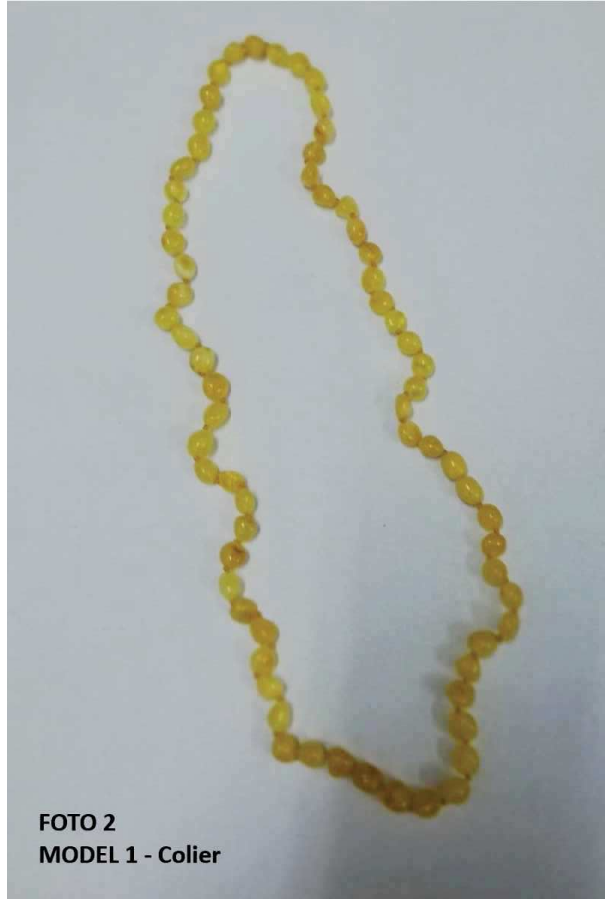
FOTO 2 MODEL 1 - Colier