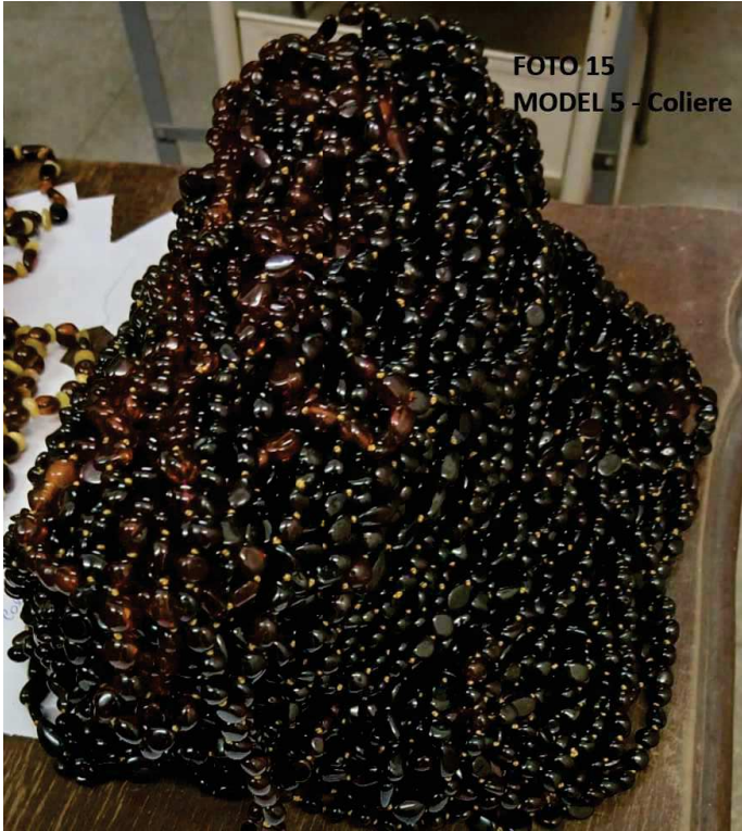
FOTO 15 MODEL 5 - Coliere