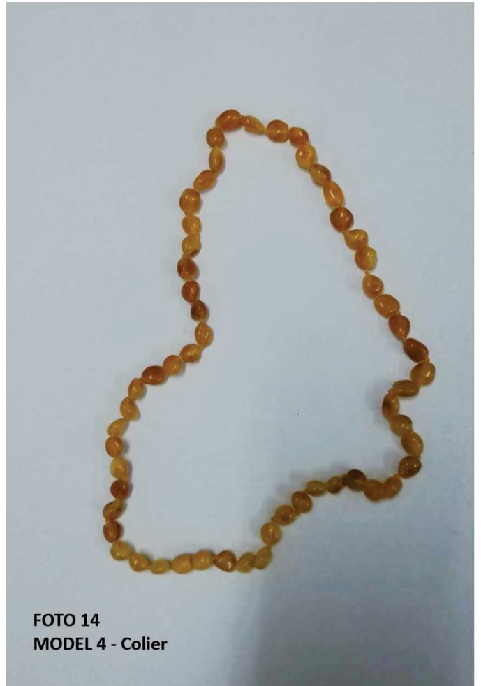
FOTO 14 MODEL 4 - Colier