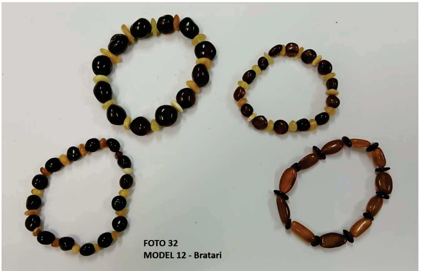
FOTO 32 MODEL 12 - Bratari