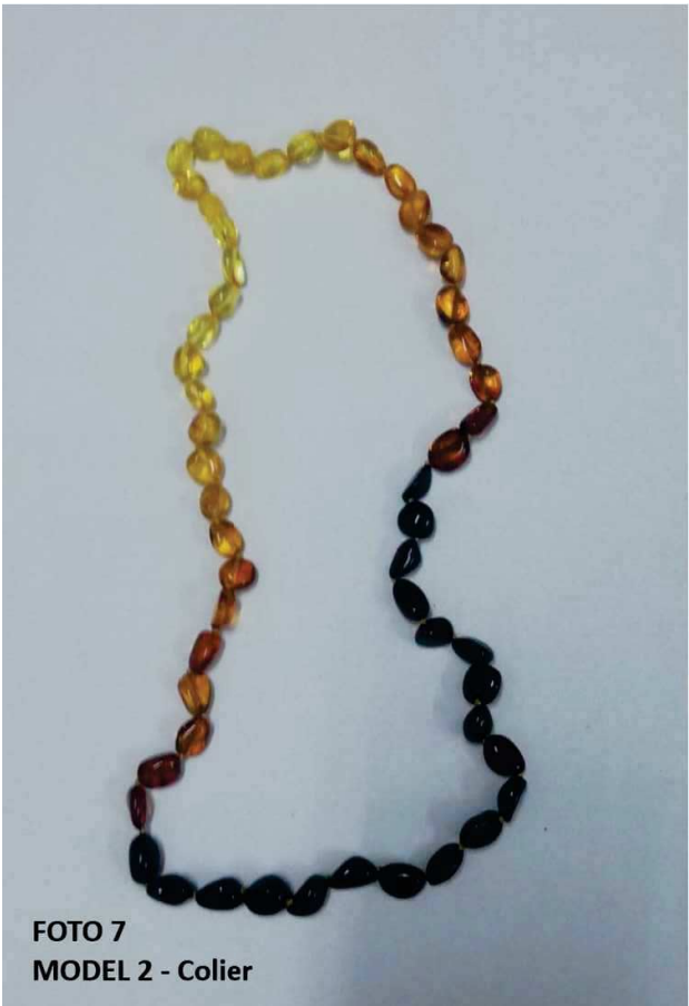
FOTO 7 MODEL 2 - Colier