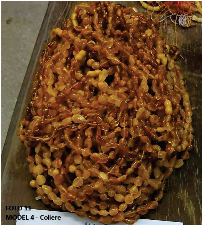
FOTO 11 MODEL 4 - Coliere