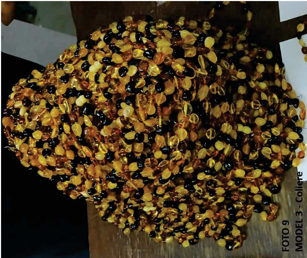
FOTO 9 MODEL 3 - Colliere