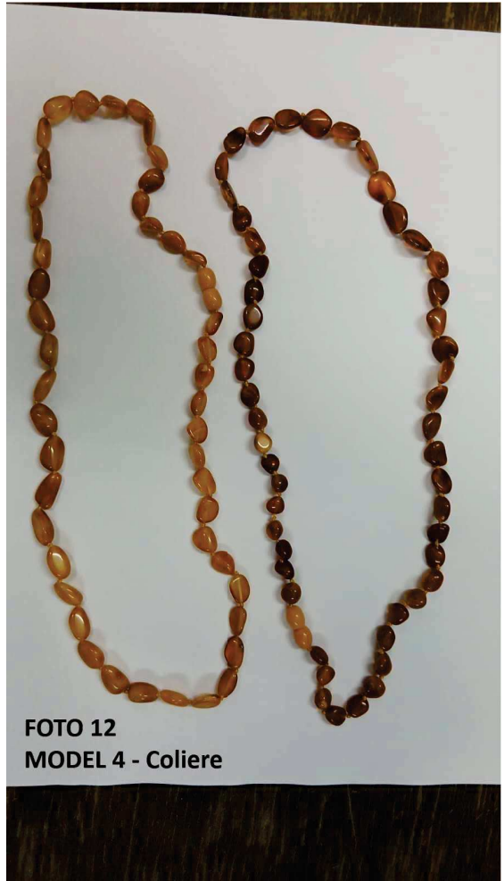
FOTO 12 MODEL 4 - Coliere