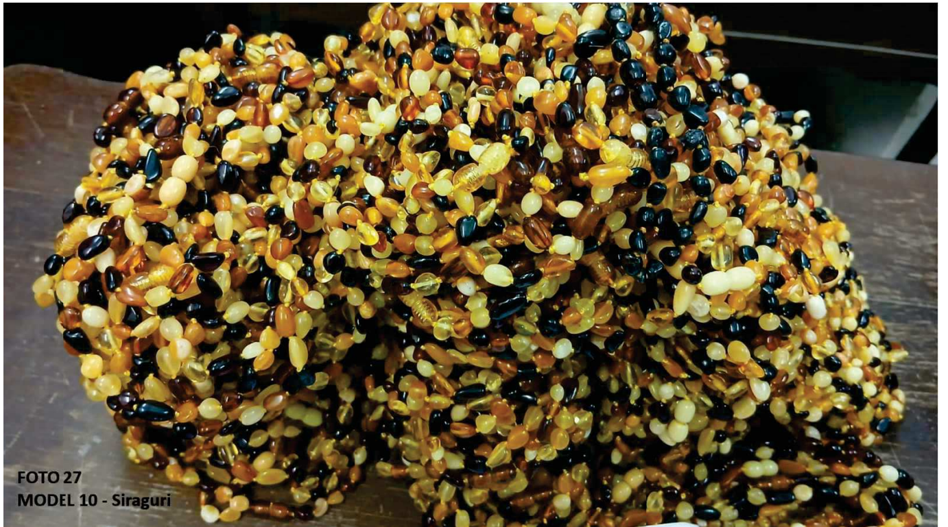
FOTO 27 MODEL 10 - Siraguri