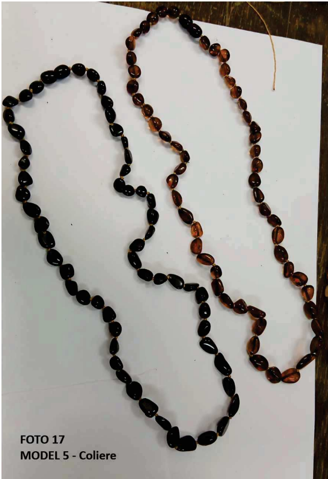
FOTO 17 MODEL 5 - Coliere