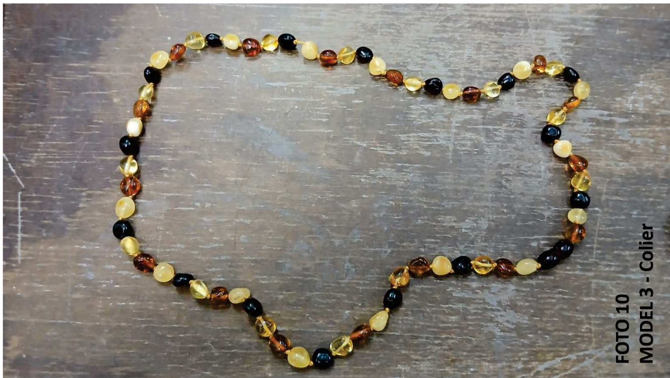
FOTO 10 MODEL 3 - Collier