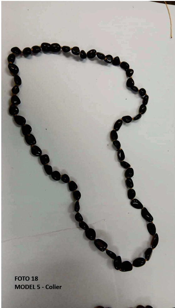
FOTO 18 MODEL 5 - Colier