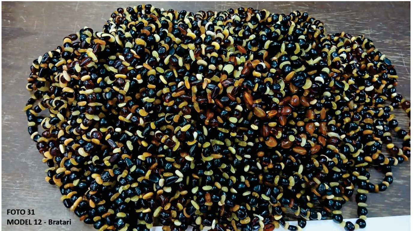
FOTO 31 MODEL 12 - Bratari