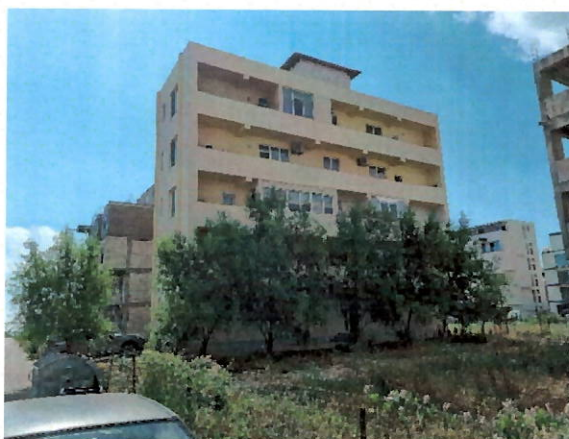
Vedere generala imobil apartinător