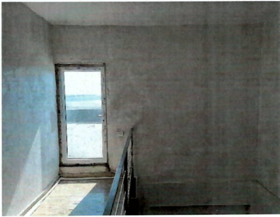
Vedere usa acces terasa