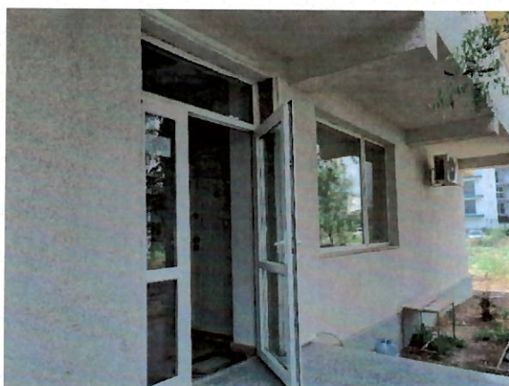
Vedere acces imobil apartinător