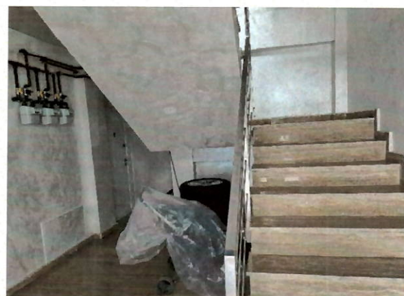
Vedere casa scarii