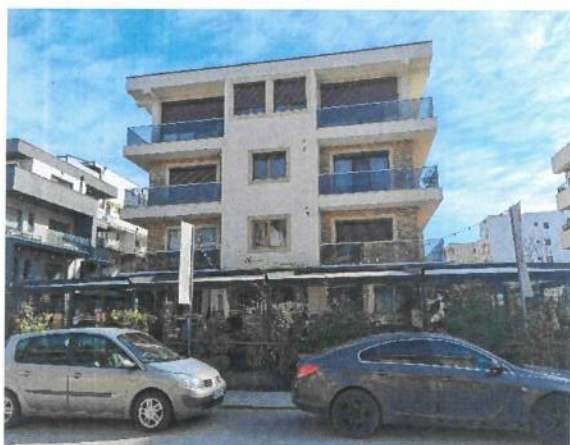
Vedere generala imobil apartinator