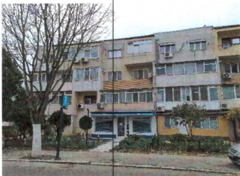
Vedere generala imobil apartinator