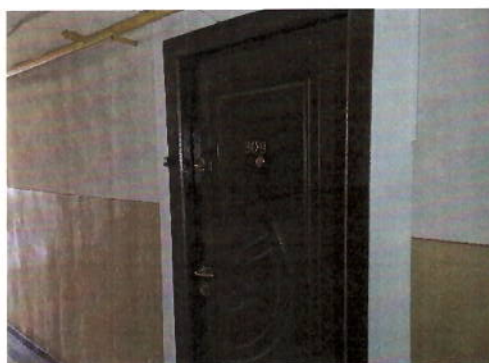
Vedere usa acces apartament