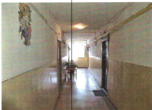
Vedere casa scarii etaj 3