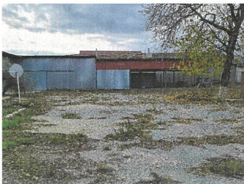
Vedere Spatiu depozitare C5