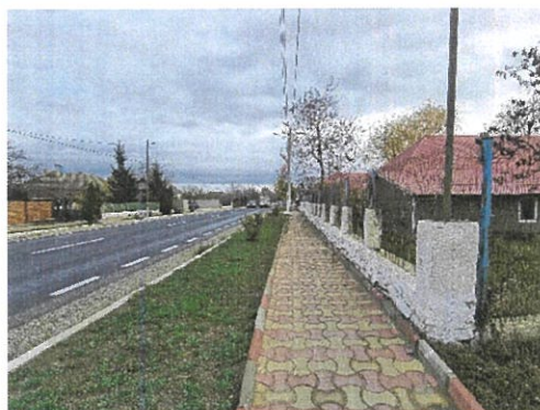
Vedere cale acces si vecinatati