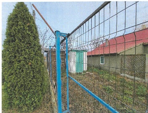
Vedere Wc C6