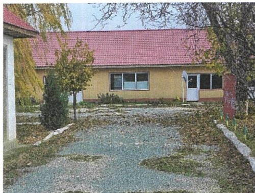
Interior Spatiu comercial C4