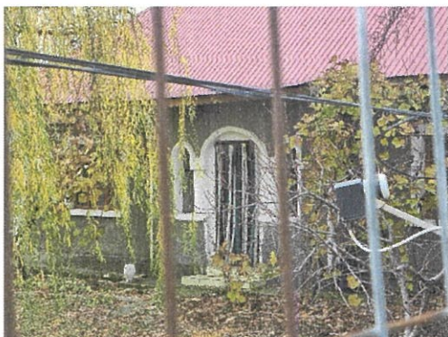
Vedere Locuinta C1