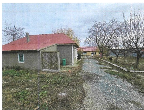
Interior Locuinta C1 si bucatarie vara C2