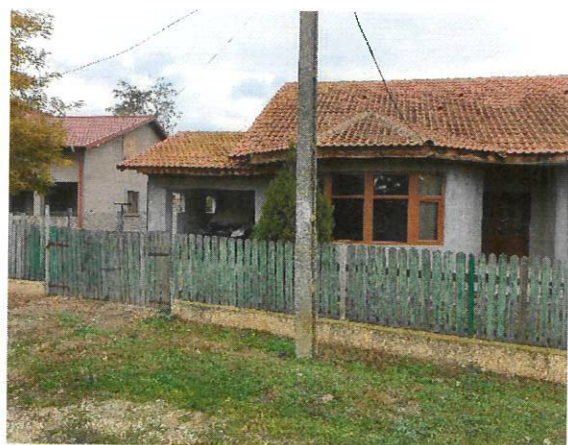
Vedere Locuinta C1