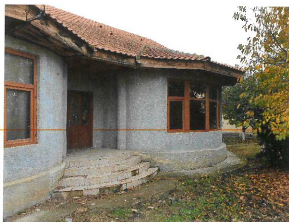
Vedere Locuinta C1