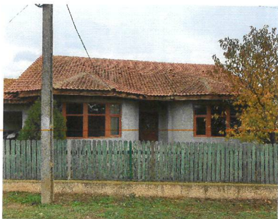
Vedere generala imobil