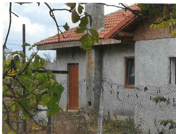
Vedere Locuinta C1