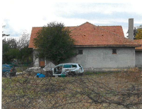
Vedere Locuinta C1 si curte- vedere din strada Verde