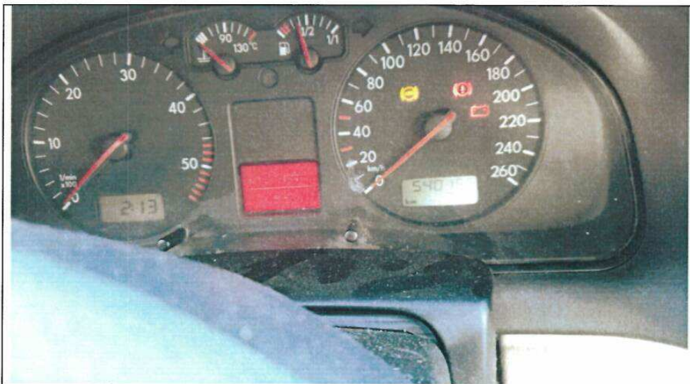
5. Planse foto SJ-07-MET: ➔